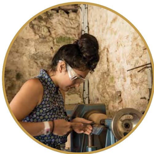
LESSAC / FRANKREICH

Den gestandenen Gestaltern und den Newcomern der Designszene bieten sich fürwahr immer wieder – und immer mehr – Gelegenheiten, ihre neusten Objekte der Öffentlichkeit vorzustellen. Oder sie packen die Chance beim Schopf, an Sommerworkshops in Südwestfrankreich neue zu entwerfen. ☺