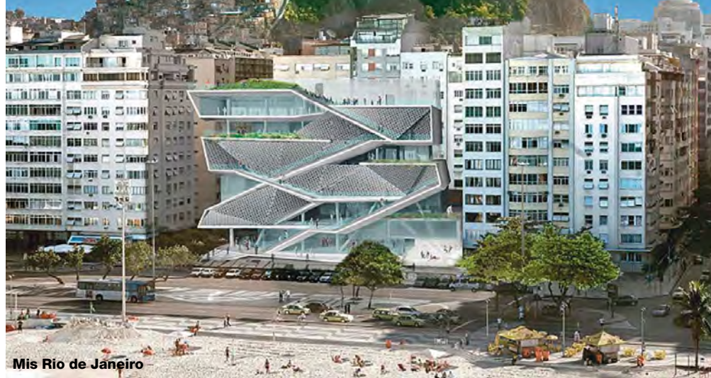
Mis Rio de Janeiro