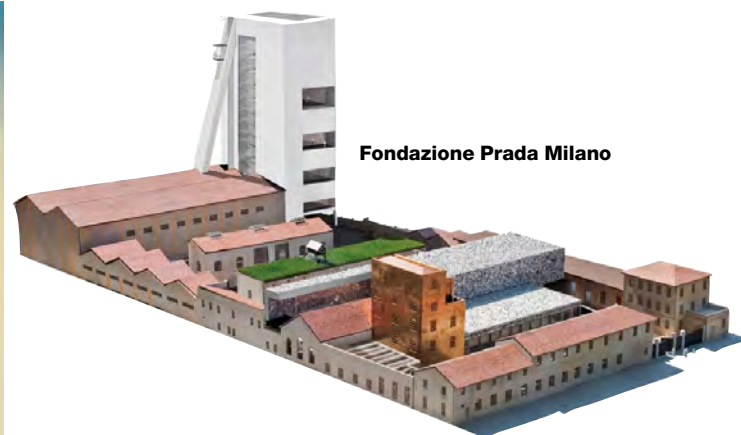
Fondazione Prada Milano

PH. ED. LEDERMAN - COURTESY DILLER SCOFIDIO + RENFRO - © PHILHARMONIE DE PARIS/ARTE FACTORY - COURTESY OMA E FONDAZIONE PRADA