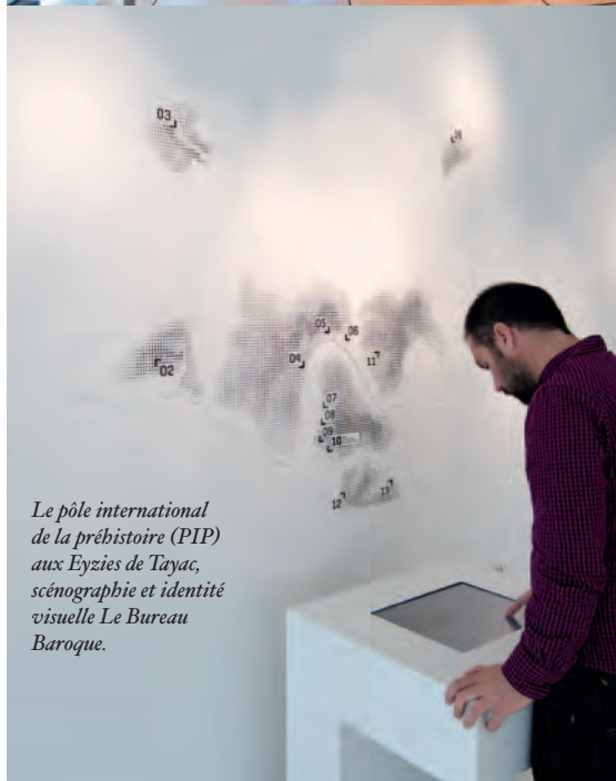
Le pôle international de la préhistoire (PIP) aux Eyzies de Tayac, scénographie et identité visuelle Le Bureau Baroque.