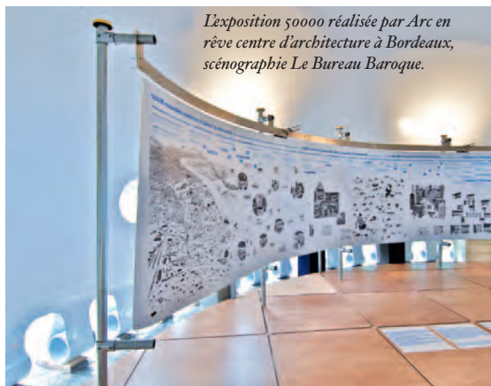
L'exposition 50000 réalisée par Arc en rêve centre d'architecture à Bordeaux, scénographie Le Bureau Baroque.