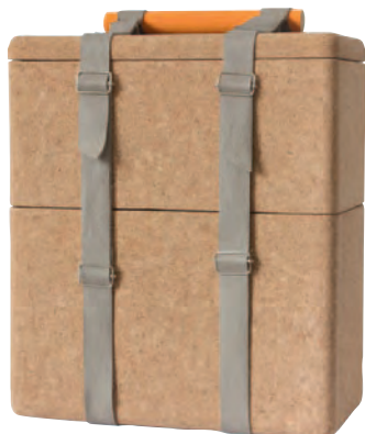
La glacière "Day Off", design Zaven Studio avec Amorim.