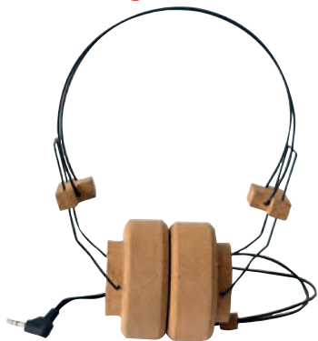
Le casque "Songs", design Pauline Auriaux et Jacopo Ferrari avec Amorim.